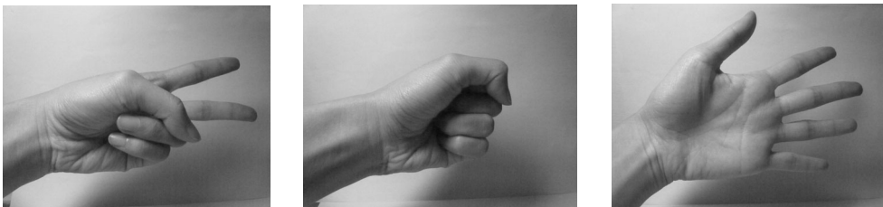
圖1 三種猜拳的圖片（左起：剪刀、石頭、布）