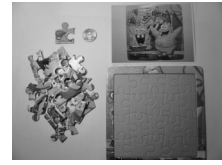
圖8 施測的擺放位置