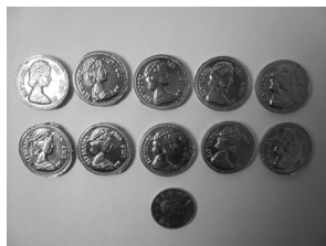
圖2 十個金幣巧克力